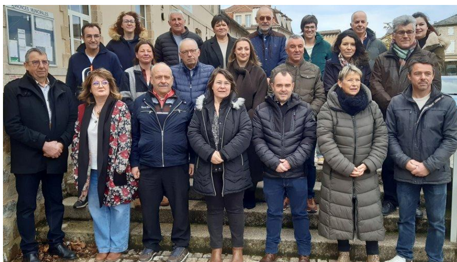
Equipe municipale de Sousceyrac-en-Quercy en 2026